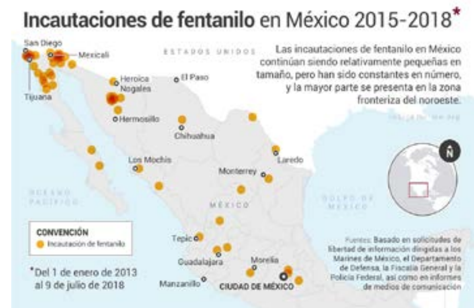
Gráfico 4. Incautaciones de fentanilo

Aunado a lo anterior, las restricciones para la producción de fentanilo en China y los mayores controles de seguridad en puertos como el de Los Ángeles (California) hicieron de puertos como el de Guaymas una puerta de entrada ideal para los precursores para la elaboración de fentanilo que después sería transportado por tierra a través de la frontera estadounidense (Redacción La Vanguardia, 2019). En otras palabras, los grupos criminales mexicanos supieron aprovechar la oportunidad de negocio generada por los mayores controles en China para la producción y exportación de fentanilo. En el gráfico 4 es posible observar que las incautaciones de fentanilo se concentran en las rutas que cruzan por Baja California y Sonora.